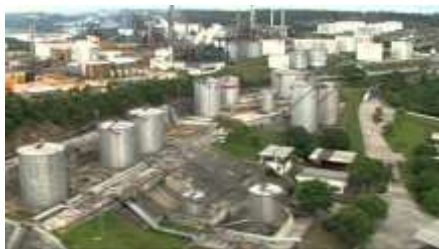
bairro _ industrial