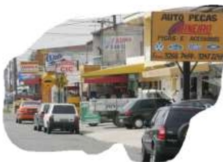
bairro _ comercial