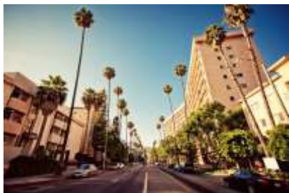
bairro _ residencial

5) Nomeie os bairros abaixo de acordo com as fotos.