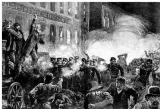
Revolta de Haymarket. Ilustração de Thure de Thulstrup (1886).

A história do Dia do Trabalho surgiu em Chicago, nos Estados Unidos, em 1º de maio de 1886, quando muitos trabalhadores foram às ruas para protestar contra jornada exaustiva diária, que podia chegar até 17 horas. Homens e mulheres lutavam por uma carga horária de 8 horas e melhores condições de trabalho. No mesmo dia, todos os trabalhadores americanos realizaram uma greve geral no país. As manifestações ficaram conhecidas como a Revolta de Haymarket .