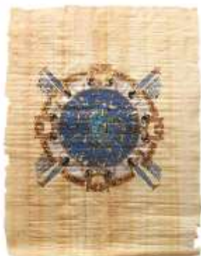
Calendário feito pelos antigos egípcios.

1 - Há mais de 4 mil anos, os antigos egípcios já tinham criado um calendário com ano, meses, semanas e dias. Mas o calendário que usamos hoje conta os anos somente a partir do nascimento de Jesus Cristo.